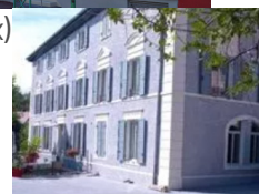
B&B A Deux Pas du Rhéby (Villebois) www.adeuxpasdurhone.com/a-deux-pas-du-rheby