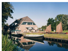
Hotel de Harmonie **** (Giethoorn) www.harmonie-giethoorn.nl