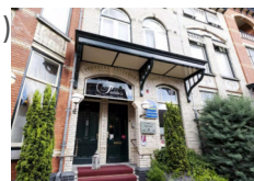
Hotel Fidder *** (Zwolle) www.hotelfidder.nl