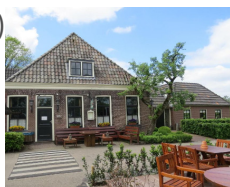
Hotel Geertien *** (Blokzijl) www.geertien.nl